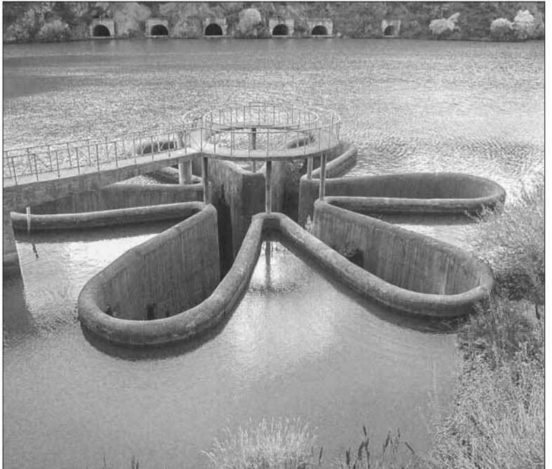
Համի ջրամբարի հորանային ջրաթափը

«Նորանոր հարկատեսակների, պարտադիր ապահովագրումների եւ չդադարող թանկացումների միջոցով ժողովրդի վերջին լուծանքը ՇԱՐՈՒՆԱՎՈՒԹՅՈՒՆԸ ԷՋ 8