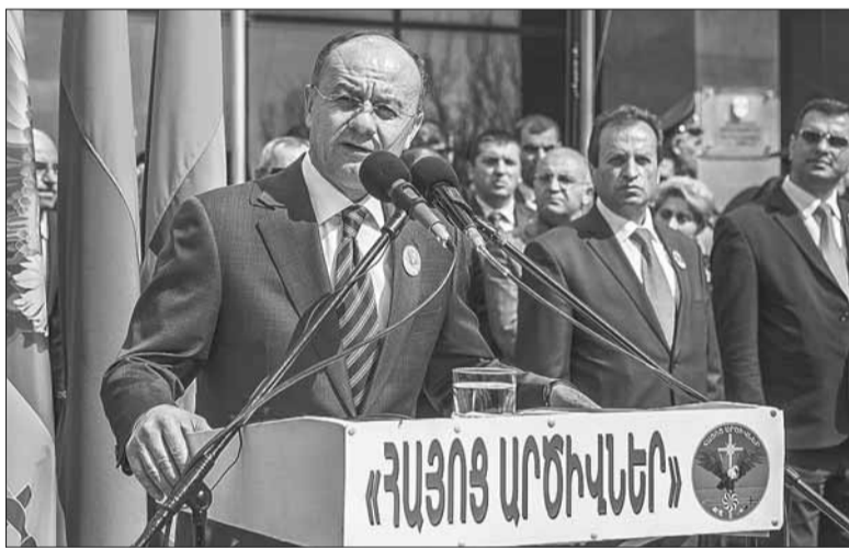
ՀՀ պաշտպանության նախարար Սեյրան Օհանյանը