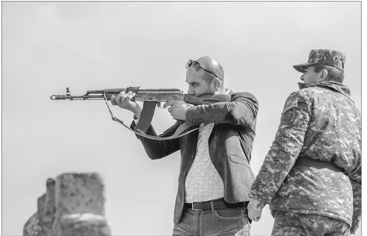
Մարշալ Բաղդամյանի անվան զորավարժարանի հրաձգարան